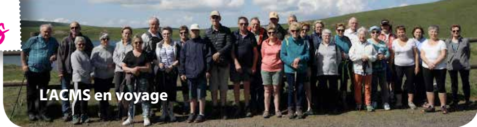
L'ACMS en voyage

Après une pause estivale, la chorale reprendra ses répétitions avec déjà de nombreux projets : un week-end de rentrée à Gramat, un voyage en Espagne au mois de mai et, bien sûr, des répétitions, des journées de formation et des concerts. Si ces différents projets vous intéressent et que vous avez envie de venir nous rejoindre, nous vous accueillerons avec plaisir. Nous répétons tous les jeudis soirs de 20h30 à 22h30 à la salle polyvalente de Sarran. Bel été à tous !